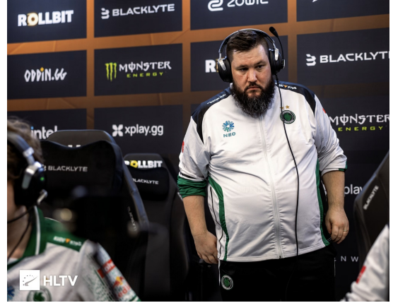
Fig. 2: Zonic 教练风采及肚脐力学支撑拓扑示意图，其引力场完美覆盖了选手席