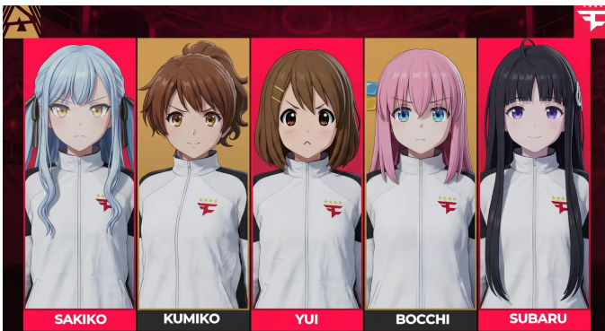
Fig. 6: FaZe Clan 抽象二次元拟人化列阵 (FaZe Up!) (最好的五个人!)